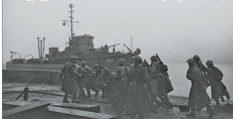
Высадка десанта в п. Маока.