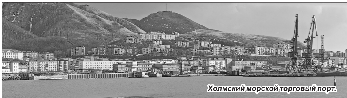
Холмский морской торговый порт.