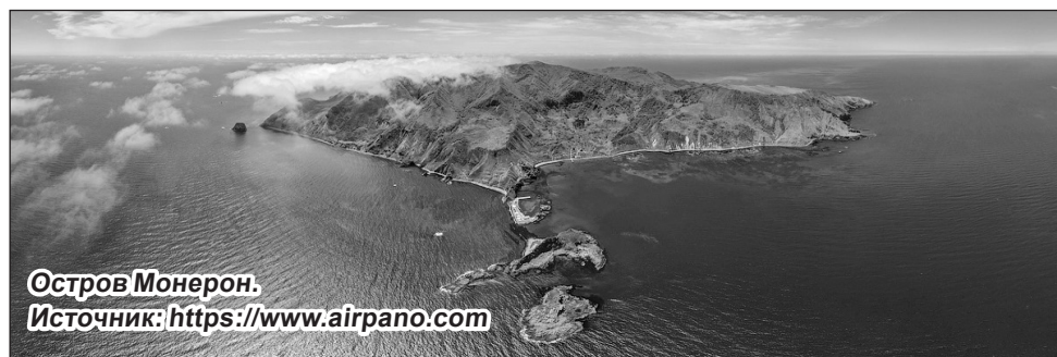
Остров Монерон.

Глава региона подчеркнул, что область должна развивать целую сеть круизных маршрутов. По его словам, такие поездки должны быть доступны не только туристам, но и жителям области.