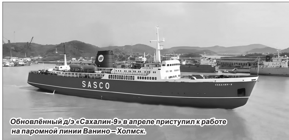
Обновлённый д/э «Сахалин-9» в апреле приступил к работе на паромной линии Ванино – Холмск.