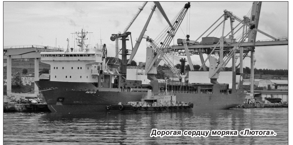
Дорогая сердцу моряка «Лютюга».