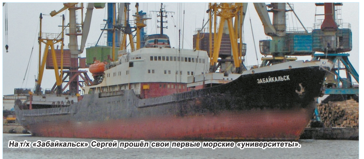
На т/х «Забайкальск» Сергей прошёл свои первые морские «университеты».